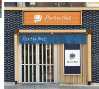
「Porter Net」の 窓口イメージ