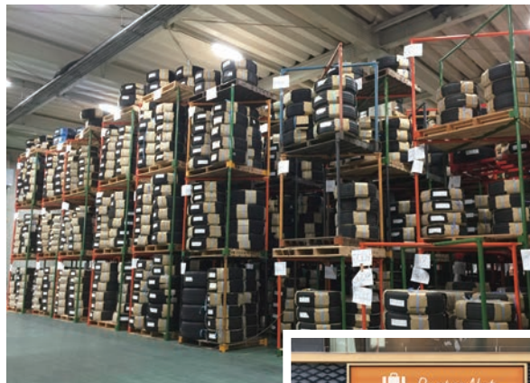
自動車用タイヤ保管サービスは 大阪にもエリア拡大